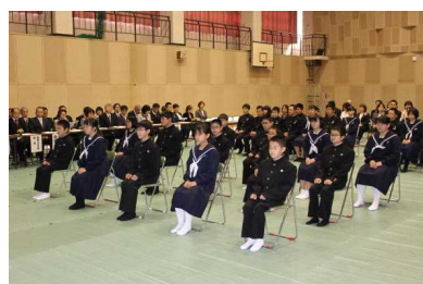
意欲にあふれる新入生