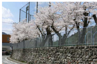
満開の校庭のサクラ

4月9日は入学式で、14名の生徒が本校の門をくぐりました。3年生には2名の転入生があり、本年度の全校生徒数は42名。生徒たちの活躍を楽しみにしています。さっそく5月には小中合同運動会があります。昨年を超える運動会をめざし、生徒たちは春休みから応援の練習を頑張っています。「チーム星野」で成功させたいと思っています。