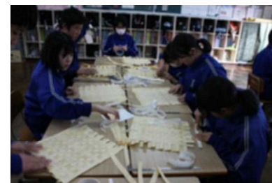
ランチョンマットの作成

そのあと学校に帰り、木を使った工芸品作りを行いました。あらかじめ地元の工場にお願いして短冊状に薄くした木の板を用意してもらい、それを縦横で交互に編むようにすると、ランチョンマットができました。