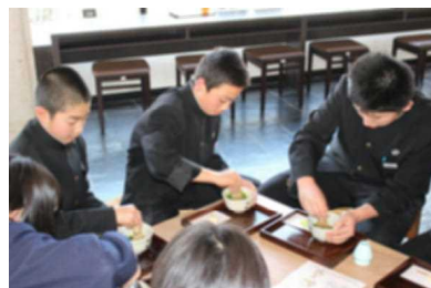
無心にお茶を点てる子ども達

まず1月29日はお茶の淹れ方について学びました。当日は、JAやお茶生産者の方々から、急須をつかっての美味しいお茶の淹れ方を教えていただきました。また茶の文化館からも来ていただいて、和菓子作りにも挑戦しました。