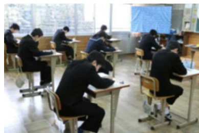
中学生最後の試験に臨む3年生

太陽の光は日に日に強さをまし、春の気配を感じる今日この頃です。今年の冬は北海道などでは寒さが厳しかったようですが、私たちが住んでいるこの地ではあたたかい日が多く大雪に見舞われることもありませんでした。しかし異常に空気が乾燥した日が続き、インフルエンザの流行が問題となりました。幸いにも本校では集団での感染はなく今に至っています。