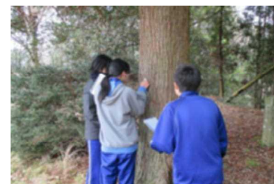
どんな音が聞こえるかな

星野はお茶で有名ですが、林業も盛んです。本校では星野についての理解を深めるため、2年生では花木体験学習と題して行事を行っています。2月1日、木の専門家の方をゲストティーチャーとして招き学習を行いました。