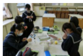
心を込めて作成中

例年3年生が行っていた星光園での保育実習が、今年度は新型コロナウイルスのために中止になりました。しかし、家庭科の授業で幼児のおもちゃをつくる学習をしたので、できあがったお手玉やままご道具を星光園へ贈りました。星光園の先生と園児達にはとても喜んでもらいました。