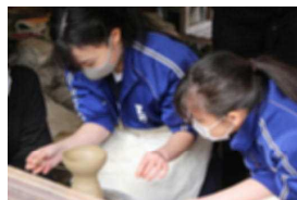
うまく切れるかな

3年生は12月9日に源太窯に行き、陶芸体験をしました。最初は、ろくろを使うのに悪戦苦闘しているようでしたが、だんだん慣れてくると上手に形を整え、きれいな器ができあがりました。器は乾燥させた後、釉薬をかけて焼かれ1月には子ども達に届くそうです。卒業の記念になることと思います。